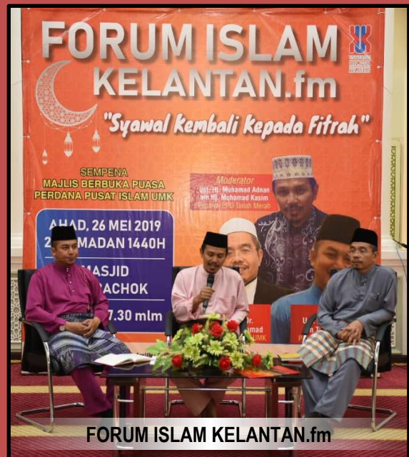
FORUM ISLAM KELANTAN.fm