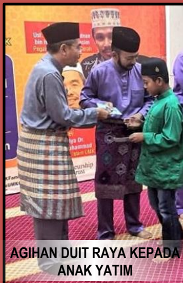
AGIHAN DUIT RAYA KEPADA ANAK YATIM