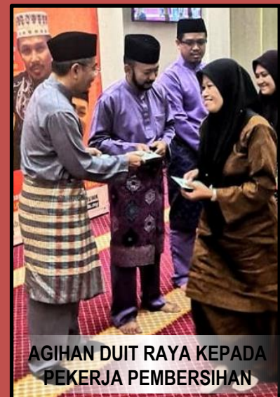
AGIHAN DUIT RAYA KEPADA PEKERJA PEMBERSIHAN