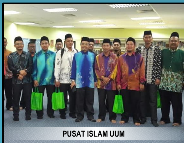
PUSAT ISLAM UUM