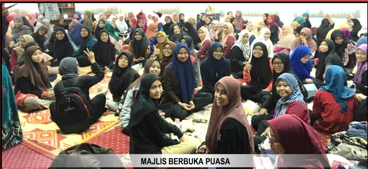
MAJLIS BERBUKA PUASA