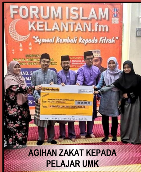
AGIHAN ZAKAT KEPADA PELAJAR UMK