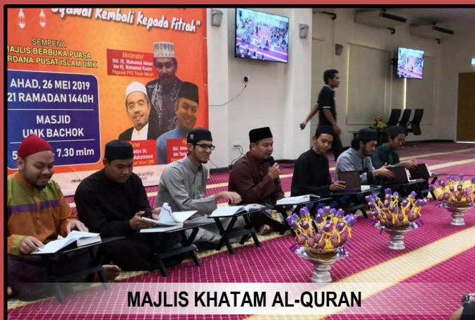
MAJLIS KHAMAT AL-QURAN

Pada akhir majlis, semua hadirin dijemput menjamu selera dengan berbuka puasa secara beramai-ramai di koridor Masjid UMK Bachok.