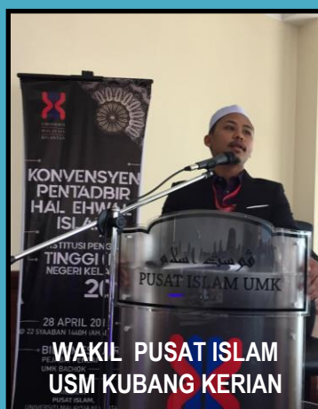
WAKIL PUSAT ISLAM USM KUBANG KERIAN