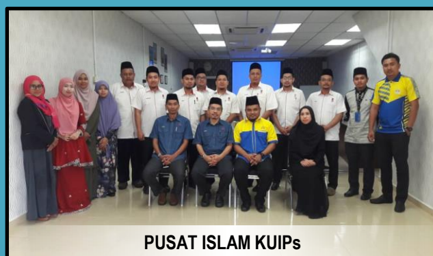
PUSAT ISLAM KUIPs